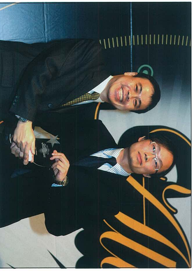
藉著BIZCON Recovery SANter解決方案，SPCA勇奪全球知名IT雜誌 Network World Asia所頒發的“Enterprise All Star 2006”大獎